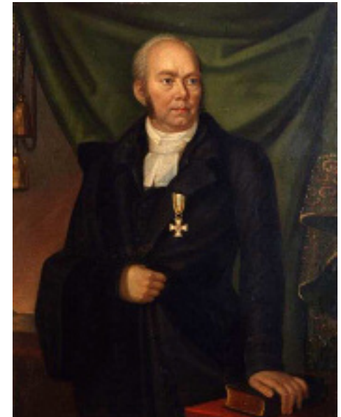
August Hermann Niemeyer (* 1. September 1754 in Halle Saale)